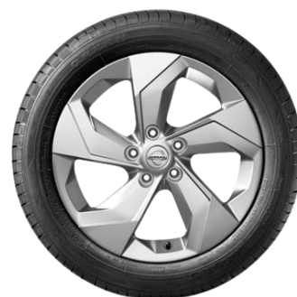
17" srebrna felga aluminiowa