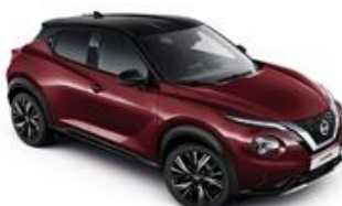
Burgundowy + Czarny dach - XDX Personalizacja wnętrza N-Design: B