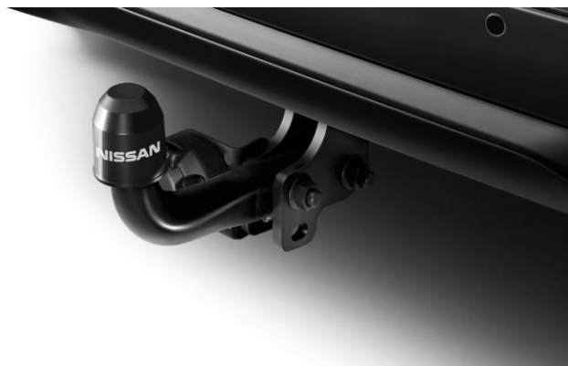
Hak holowniczy stały