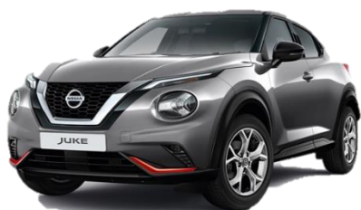
Miejski pakiet pomarańczowy