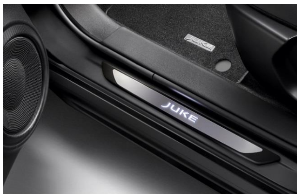
Podświetlane nakładki progów