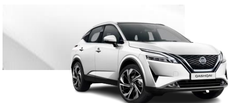
Biały perłowy - QAB