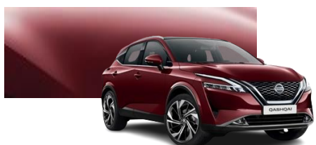
Burgundowy - NBQ