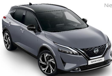
Szary ceramiczny + Czarny dach - XFU