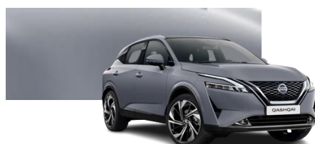
Szary ceramiczny - KBY