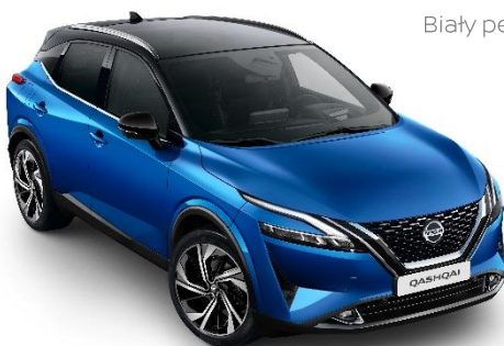
Niebieski + Czarny dach - XFV