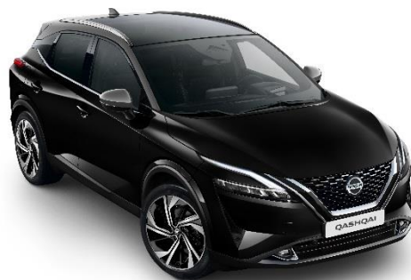
Czarny + Szary dach - XDK