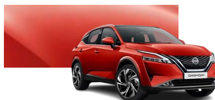
Czerwony Fuji Sunset - NBV