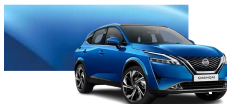
Niebieski - RCF